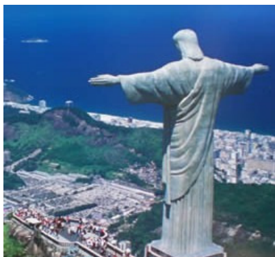
Od kilku lat polscy misjonarze czynili