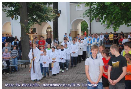
Msza św. niedzielną - dziedziniec bazyliki w Tuchowie

Warszawy, Lubaszowej, Gliwic, Głogowa, Barda, Tuchowa (jako gospodarze turnieju również wystawili swoje drużyny) oraz z Grodna (Białoruś).