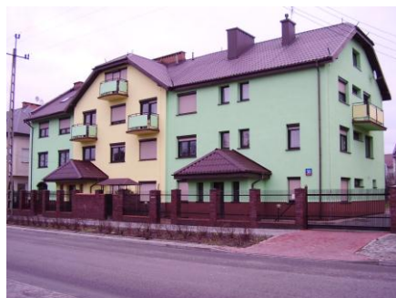
Klasztor Rogacjonistów w Warszawie

Drodzy bracia wspólnot z Warszawy i Krakowa, łączę się z wami w przeżywaniu obchodów 20-lecia naszej obecności na ziemiach polskich. Jest to czas radości, modlitwy i dziękczynienia Panu za niezliczone dary i mnogość łask, których doznała nasza Prowincja zakonna, jak również całe nasze Zgromadzenie, kiedy to niektórzy z naszych współbraci, dwadzieścia lat temu, zgodzili się z miłością i poświęceniem przyjąć zadanie rozpoczęcia obecności Rogacjonistów na terytorium Polski.