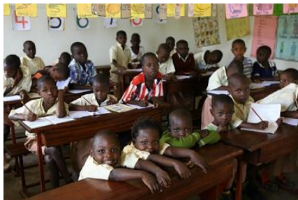
Dzieci w nowej szkole w Matugga

Wszyscy uczestnicy spotkania rozeszli się bardzo zadowoleni i obiecali swoje zaangażowanie w parafialne uroczystości. Pocięszające jest to, że z roku na rok coraz większa liczba wiernych bierze czynny udział w życiu Kościoła i parafii.