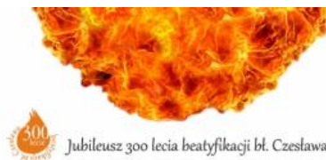
Jubileusz 300 lecia beatyfikacji bł. Czesława