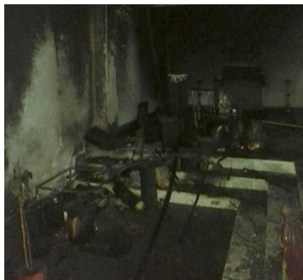
Spalony żłobek w kościele franciszkanów we Fier

Gdy usłyszał potwierdzenie, zagroził, że nie da misjonarzom spokoju. Wydawał się być pod wpływem narkotyków. Na razie nieznaną są jego przekonania religijne.