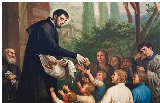
Św. Hieronim Emiliani

Ważnym celem kadry wychowawców będzie przygotowanie wychowanków do godnego, samodzielnego i odpowiedzialnego życia. Ostatecznym celem naszej pracy będzie przywrócenie dziecka jego rodzinie naturalnej.