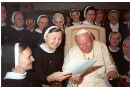
Spotkanie Bł. Jana Pawła z Siostrami Nazaretankami

Przyznał też, że również osobom konsekrowanym grozi niebezpieczeństwo, iż powiedzą Jezusowi „nie”, w niekiedy trudny do zauważenia sposób, stawiając siebie na miejscu Chrystusa.