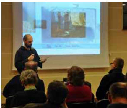
Uczestnicy pokazów o filmowej inicjatywie: Dla nas to jest wspólnota, łączenie ludzi, żeby wyszli z ulicy i zobaczyli też coś inne-

W środę, 4 lutego, odbył się kolejny filmowy pokaz. Tym razem członkowie DKF zaprezentowali produkcję „Wszystko za życie”. Na projekcję przybyło blisko 80 osób bezdomnych.