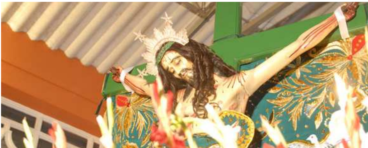
Krzyż Señor de Mayo w kościele w Pariacoto