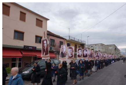
Procesja w Skutarze (spotkanie osób konsekrowanych), podczas której niesiono zdjęcia czterdziestu Męczenników Albańskich

Zgromadzenia Generalnego w tym miejscu, kiedy okazało się, iż spotkanie w Kijowie musiało być odwołane z powodu trudnej sytuacji – dziękujemy!