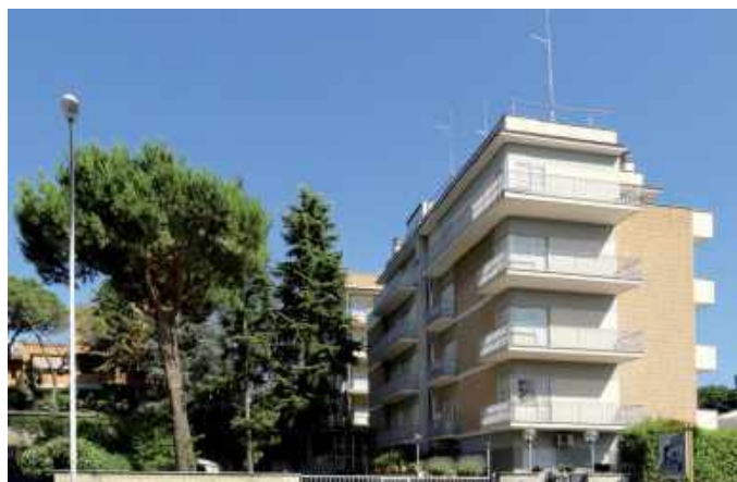
Villa Serena w Rzymie

miesiącach po przybyciu, a następnie towarzyszenie im w osiągnięciu samodzielności związanej z pracą i zamieszkaniem” – czytamy w komunikacie.