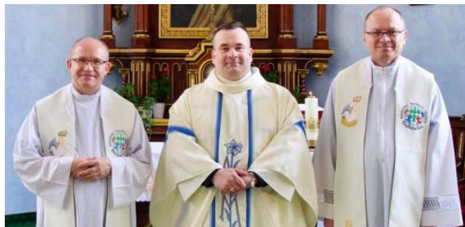
Nowy zarząd Prowincji

Po południu, o godzinie 15:00, delegaci spotkali się ponownie w kaplicy na Koronkę do Bożego Miłosierdzia i adoracji Najświętszego Sakramentu. W sesji popołudniowej sekretarze poszczególnych komisji przedstawili na forum ogólnym kapituły opinie swoich grup na temat raportu ekonomicznego. Ekonom prowincjalny udzielił kapitulantom potrzebnych odpowiedzi i wyjaśnień. Drugą część popołudniowych obrad wypełniła prezentacja tematu kapituły, metodologii pracy oraz przygotowanych postulatów. Kapitułą pracę zakończyły wspólne nieszpory.