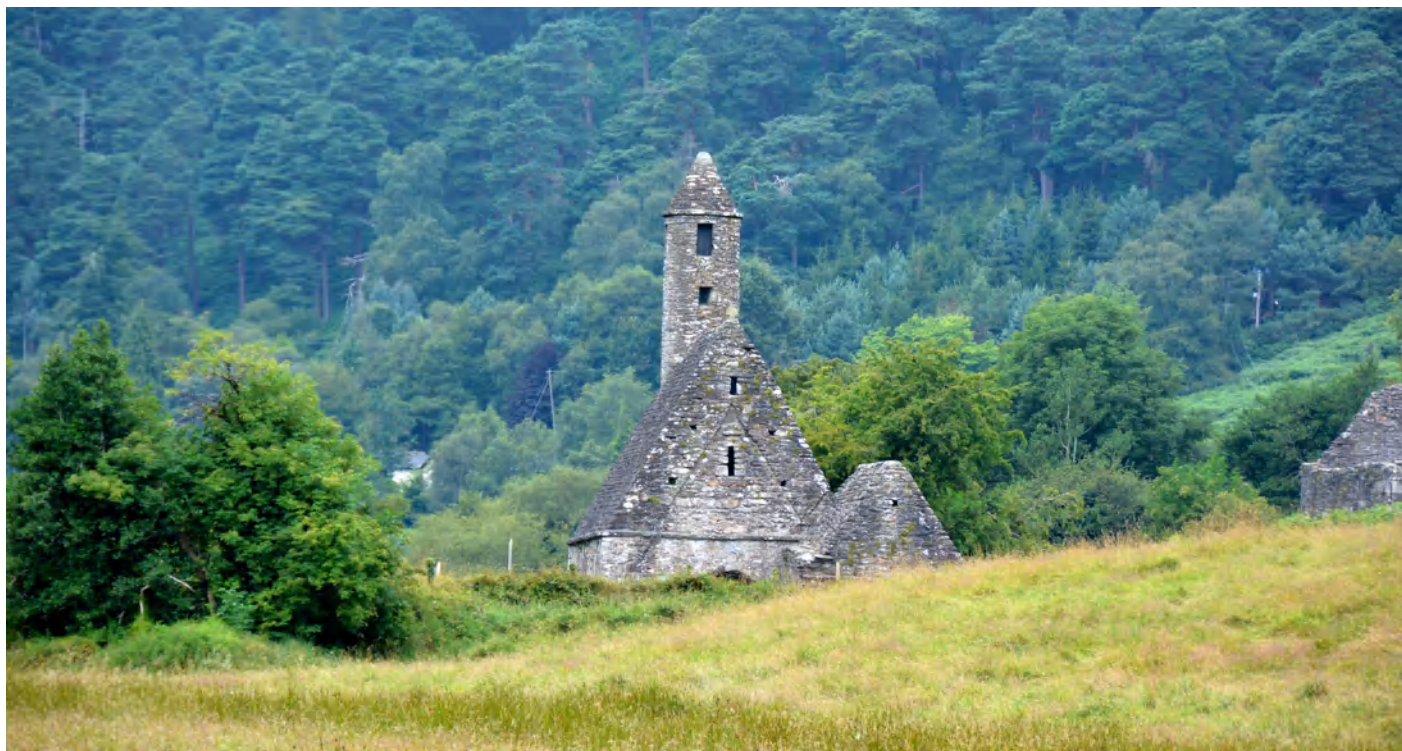
Glendalough - Irlandia