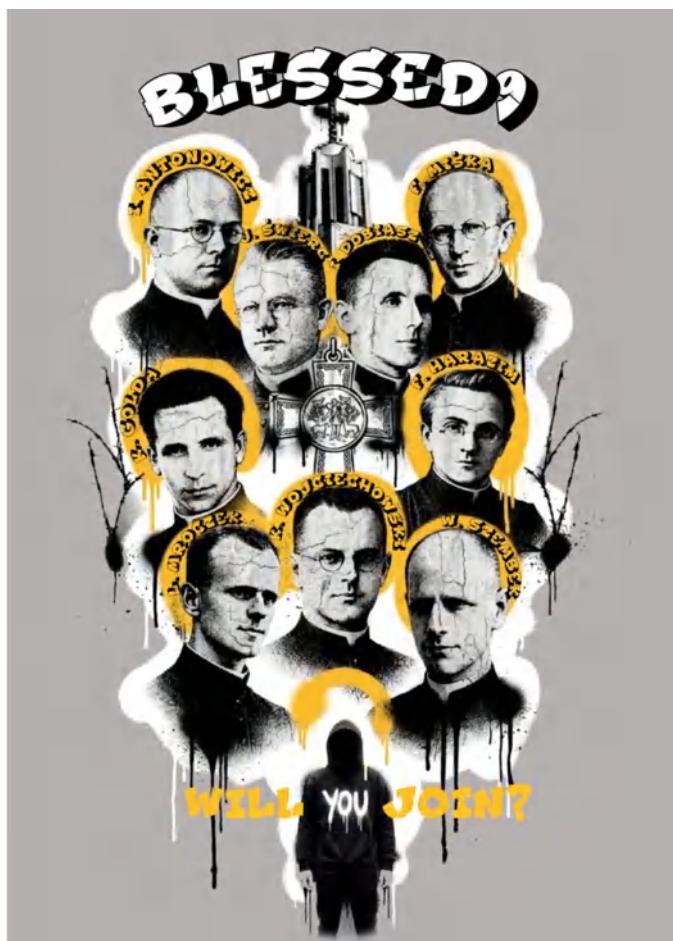
Projekt kl. Krystian Szornel; Grafika: Karolina Krzywińska

Po święceniach wrócił do Polski. Powierzano mu wiele zadań. Przygotowywał nowicjat w nowo otwartym domu salezjańskim w Daszewie, w 1905 r. został dyrektorem szkoły w Oświęcimiu (tam znajdowała się pierwsza placówka salezjańska na ziemiach polskich) a w 1911 r. kierownikiem zakładu wychowawczego im. Lubomirskich w Krakowie. W czasie I wojny światowej opiekował się rannymi żołnierzami i uchodźcami wojennymi.