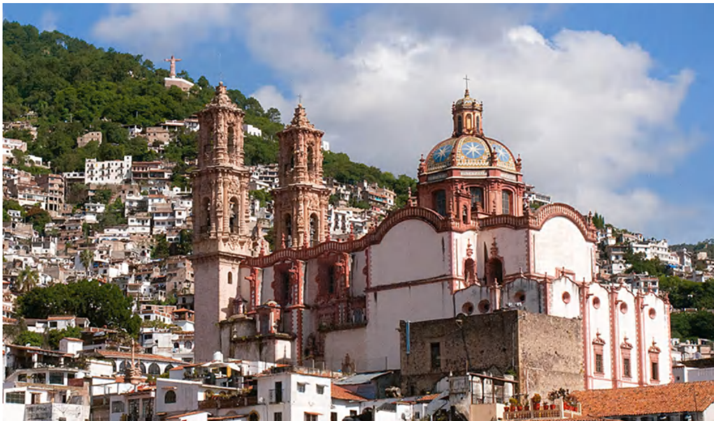
Kościół Św. Pryski w Taxco - Meksyk